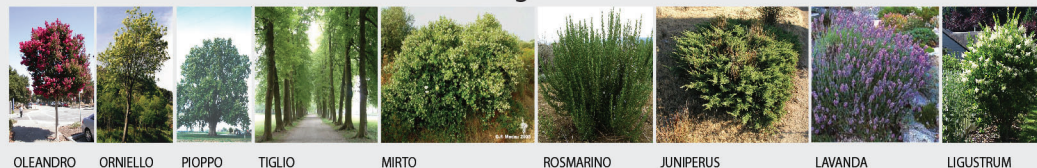
OLEANDRO ORNIELLO PIOPPO TIGLIO MIRTO ROSMARINO JUNIPERUS LAVANDA LIGUSTRUM

- Criteri complementari : Ripristino degli allineamenti degli insediamenti prospicienti la viabilità principale mediante finiture omogenee quali recinzioni, siepi di confine con il fine di perseguire una uniformità del costruito sui fronti stradali. Utilizzo di barriere e schermature naturali lungo il perimetro dell'area e in corrispondenza degli elementi maggiormente impattanti all' interno dell'insediamento come azione di mitigazione visiva.